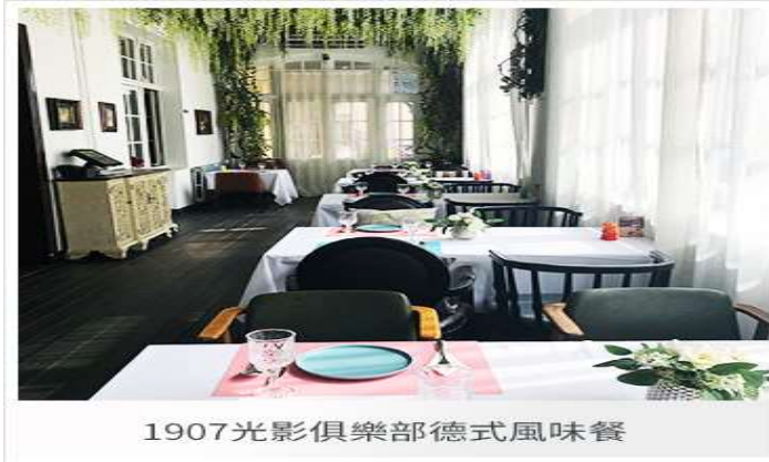
1907光影俱樂部德式風味餐

(價值人民幣 120 元)，在地特色美食饗宴！青島，有這樣一座建築，它佇立在青島的老路上，它像一台攝影機一樣，捕捉著青島的每一段影像，轉動著青島與電影命運的膠片，見證著青島的變化。它就是中國現存最早的電影院—1907 光影俱樂部。青島的每一座建築都不是冰冷的，它蘊含著整個城市的記憶，歲月與故事賦予了它的靈魂。百年之前，在那個德國駐軍青島的殖民時代，這裡是著名的水兵俱樂部。1899 年由海因裡希主持設計，1902 年才開始使用，一共三層，總面積達 4697 平方米。典型的德式建築，紅瓦黃牆對稱的建築結構充滿德式風情，據說它是青島第一個音樂廳、禮堂、第一個文化綜合體。特別安排在此內酒吧享用《德式風味餐+鮮啤酒》，包含脆皮豬腳、香腸拼盤、德式烤雞、英式炸魚薯條等等美味料理，滿足您視覺及味覺的享受，盡享青島在地美味。